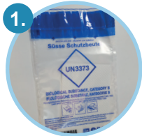
1 Schutztüte mit Saugeinlage