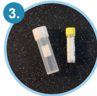
1 Urin-Röhrchen und 1 Transportröhrchen mit Saugvlies