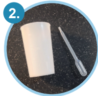
1 Urin-Auffangbecher und 1 Transferpipette